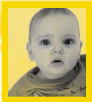
Това чаровно бебе намира своя дом в SOS-детско селище-Трявна през 1993 година